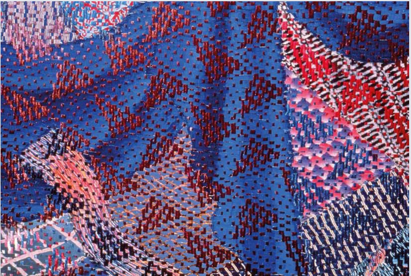
▲ 116 Crazy Quilt : Royal Remnants, détail